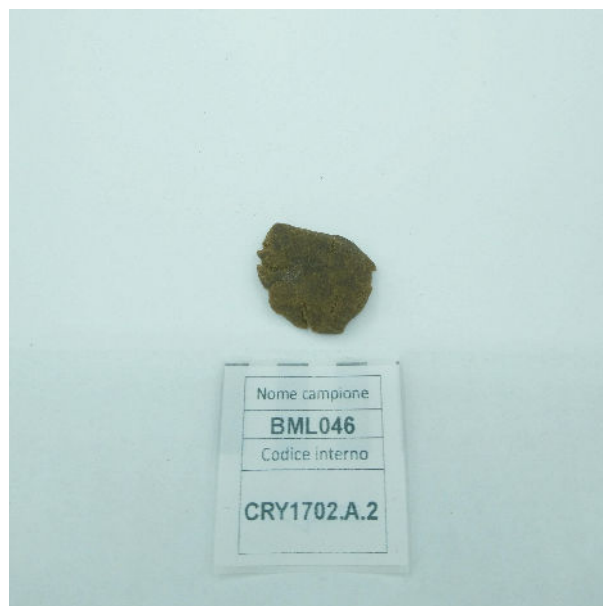
ANALYSIERTE PROBE: Finola (3,00 g)